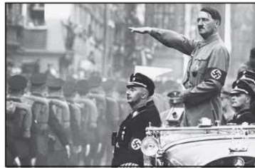
Imagen 2: Hitler