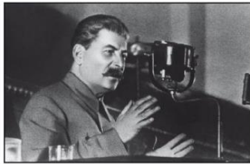
Imagen 1: Stalin

16. Observe la imagen y responda: ¿Con qué proceso histórico del siglo XX se relacionan las imágenes?