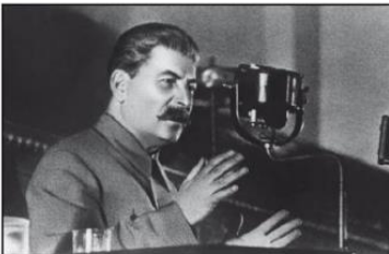
Imagen 1: Stalin