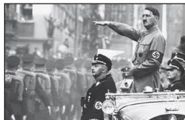
Imagen 2: Hitler