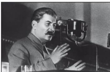
Imagen 1: Stalin