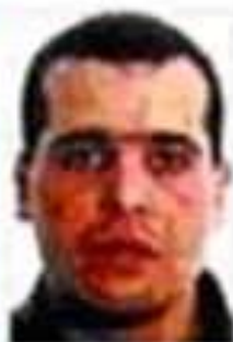
OUHMANE, 'WANTED' El argelino Dawud Ouhmane, uno de los sospechosos de los atentados del 11-M, fue detenido en Bagdad en 2003. En la imagen, Ouhmane en un momento de su estancia en la prisión de Guantánamo.