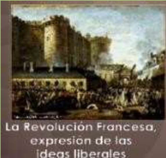
La Revolución Francesa, expresión de las ideas liberales