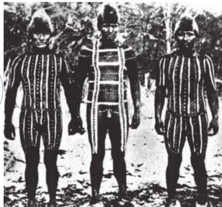
■ Fuente primaria Hombres selk'nam en la comarca del hain. foto antigua

Las fuentes primarias son aquellas que dan testimonio o evidencia directa sobre el tema de investigación. Las fuentes primarias fueron escritas durante el tiempo que se está estudiando, o bien, por una persona que estuvo directamente envuelta en el evento. Las fuentes secundarias están construidas a partir de fuentes primarias.